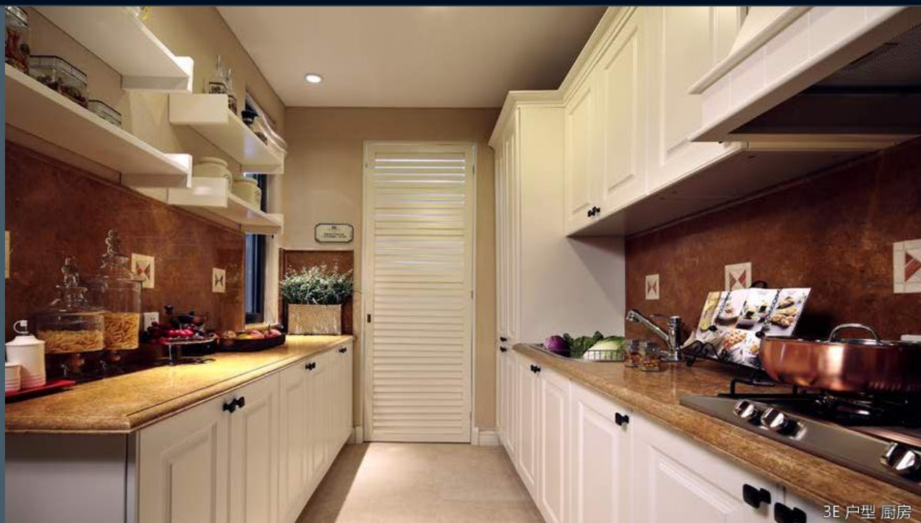
3E 户型 厨房