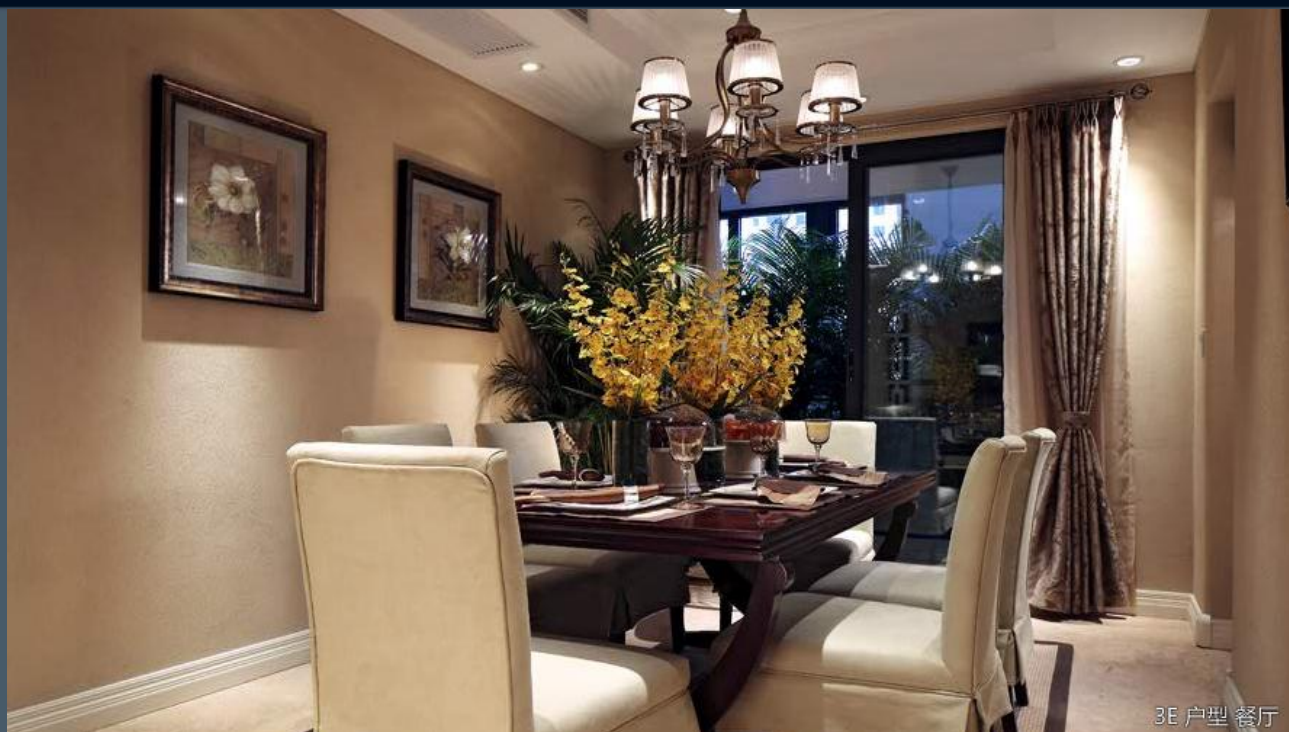
3E 户型 餐厅