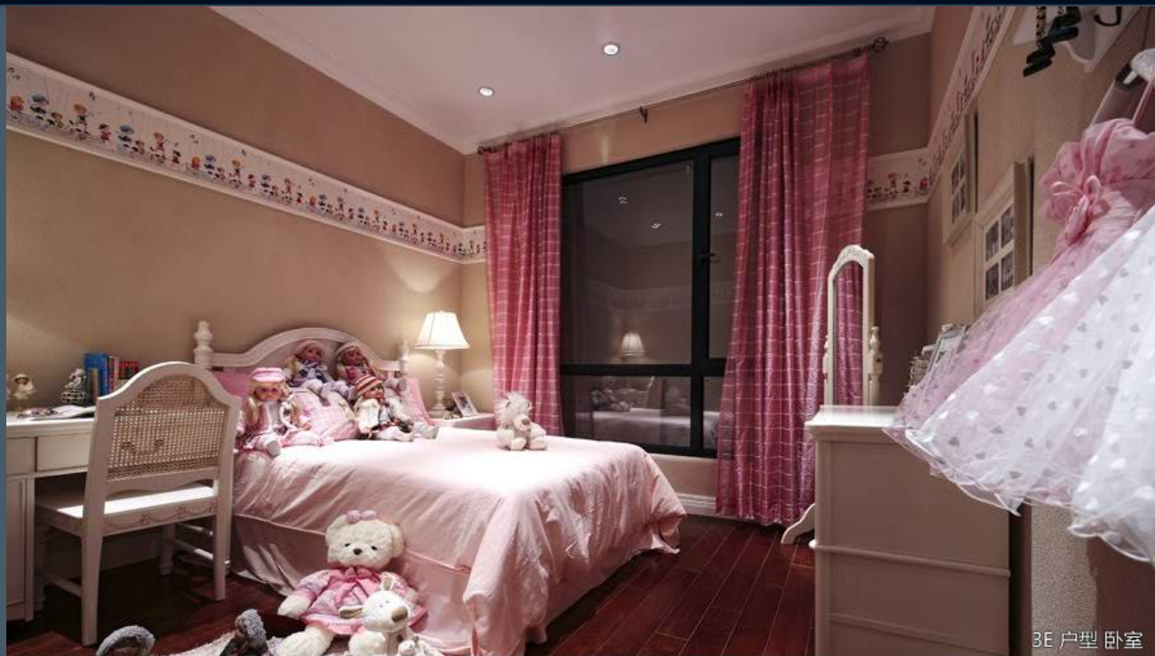
3E 户型 卧室