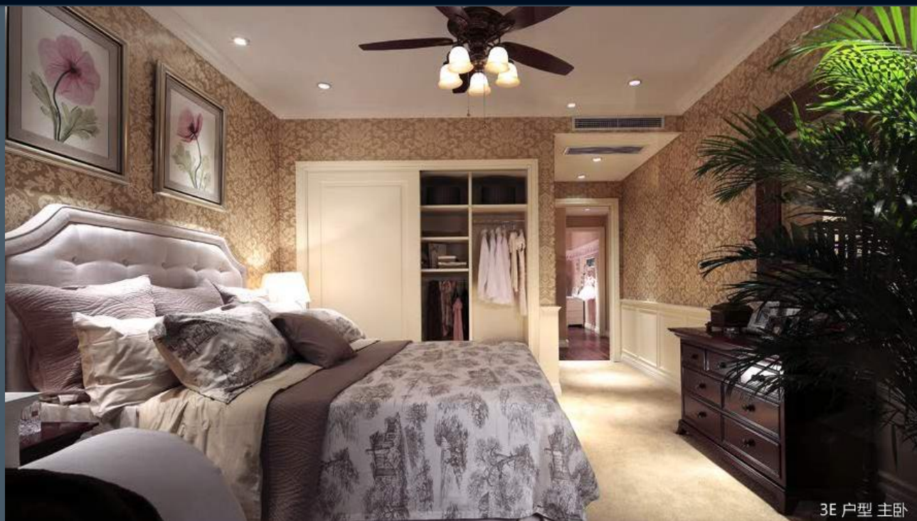
3E 户型 主卧